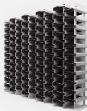
Esigo .2 file