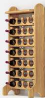
Esigo .2 classic