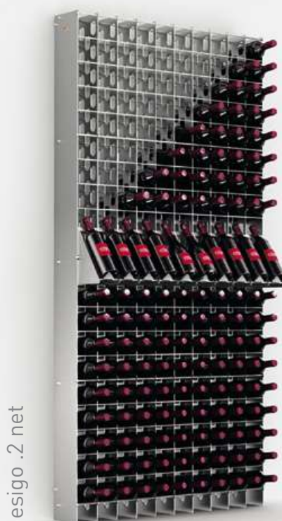
esigo .2 net