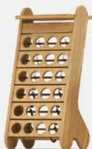
Esigo .1 classic