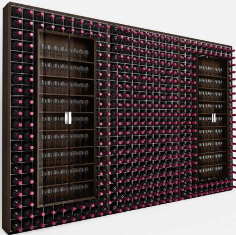
esigo .2 wall