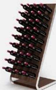
Esigo .4 tech