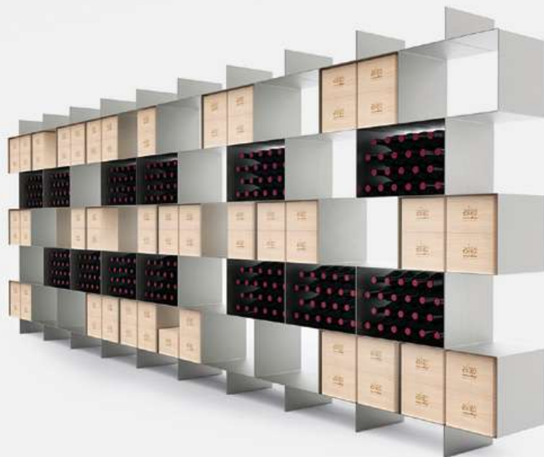
esigo .2 box